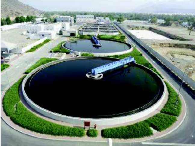
Abb. 1: Nachklärbecken der Kläranlage Fujairah/Vereinigte Arabische Emirate

dung für einen erweiterten Temperaturbereich von 5–30 °C ermöglicht [2].